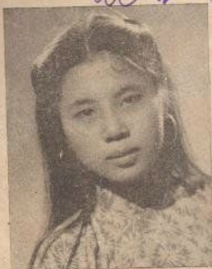
THỦY - NGÀ