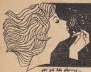
gợi gió hồn phượng...